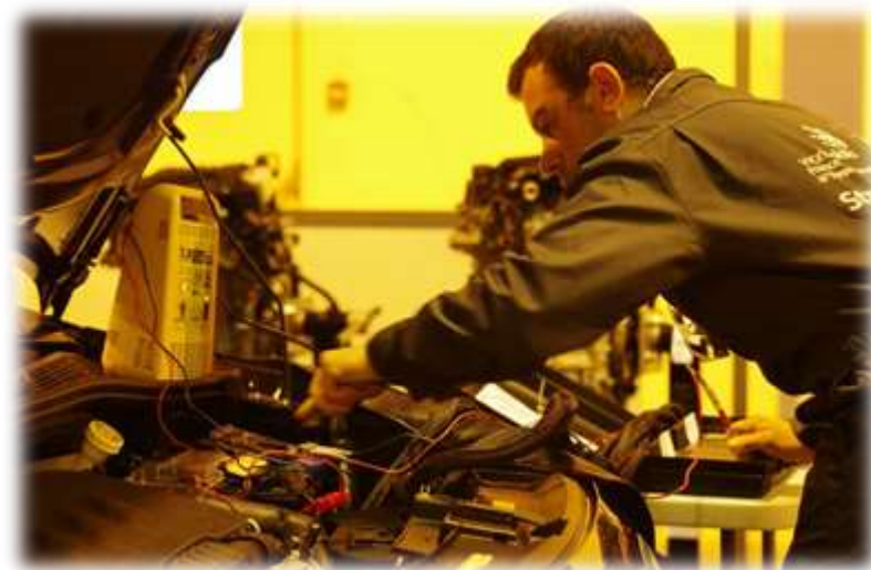
Certificat d'Aptitude Professionnelle Option A: Véhicules Particuliers