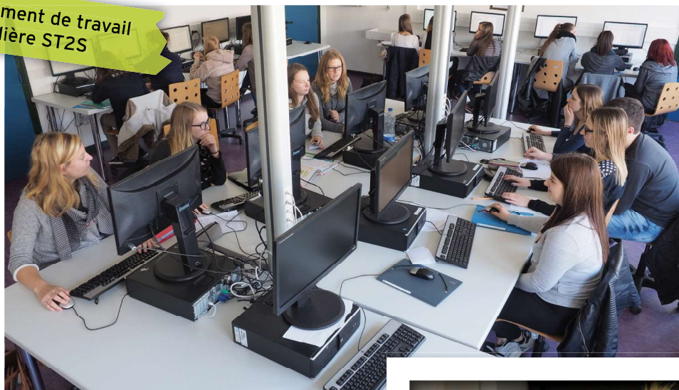
Environnement de travail en filière ST2S

Accessible à la suite d'une seconde GT, ce baccalauréat conduit à une poursuite d'études