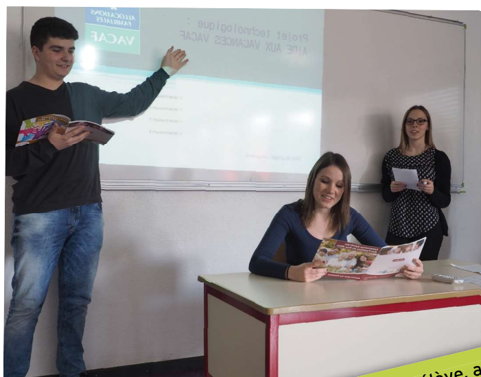
L'élève, acteur de sa formation