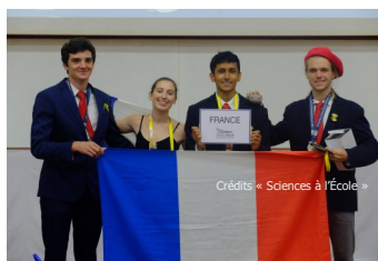
La délégation française 2018 en stage de terrain (à gauche) et aux 12 e IESO en Thaïlande (à droite).