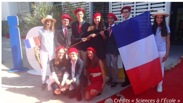
La délégation française lors de la cérémonie d'ouverture des 11 èmes Olympiades internationales de géosciences à Nice, en août 2017.

En inscrivant leurs élèves à la préparation et sélection françaises des IESO, les enseignants accèdent à un catalogue de ressources en ligne pour les préparer au mieux. Les élèves inscrits participent ensuite au test de sélection des IESO . La sélection des quatre élèves de première S qui représenteront la France aux IESO 2018 s'effectuera en croisant les résultats du test de sélection des IESO avec les résultats des Olympiades nationales de géosciences , ce qui justifie la nécessité d'une inscription aux deux concours.