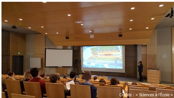
Les enseignants lors du stage au CNRS/IN2P3

Dans le cadre du plan d'équipement « COSMOS à l'École » , un stage inscrit au plan académique de formation de l'académie de Versailles a été co-organisé avec le CNRS/IN2P3 (Institut national de physique nucléaire et de physique des particules) du 20 au 22 février 2017 .