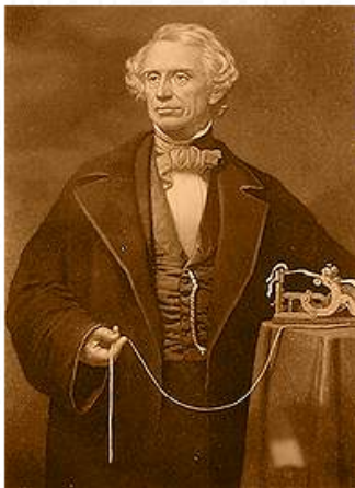
Samuel Morse (1791-1872)

Physicien américain, Samuel Morse est né le 1 janvier 1791. Il est mort le 1 janvier 1872. Il a inventé un télégraphe électrique. Avec l'aide du Congrès américain, le premier message en morse est envoyé le 24 mai 1844 via une ligne reliant Baltimore à Washington.