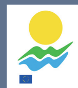
LES PRODUITS BÉNÉFICIAINT DU LOGO « RÉGION ULTRAPÉRIPHÉRIQUE » (RUP)

Le symbole graphique des régions ultrapériphériques (couramment dénommé « logo RUP » ou « Label RUP ») vise à améliorer la connaissance et la consommation des produits agricoles de qualité, en l'état ou transformés, qui sont spécifiques aux régions ultrapériphériques, dont font partie les départements français d'outre-mer.