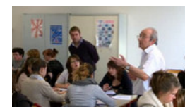
Enseignement de la philosophie avant la terminale