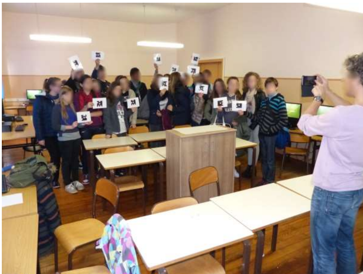
(photo prise avec l'appli au moment de scanner les résultats des votes)

Comme promis, j'ai testé l'app Plickers, boîtier de vote papier avec mes élèves ; à la fin du concours Castor-Informatique 2015 j'ai questionné les élèves sur leurs ressentis. J'ai créé une question et quatre réponses possibles (c'est le maximum); on peut récolter les réponses de façon anonyme ou individualisée à condition d'avoir renseigné la liste des élèves et distribué le pictogramme correspondant à chaque élève.