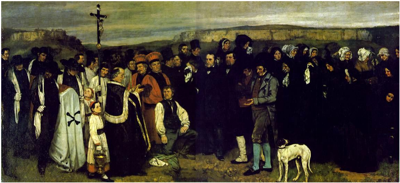
Enterrement à Ornans, 1849-1850.