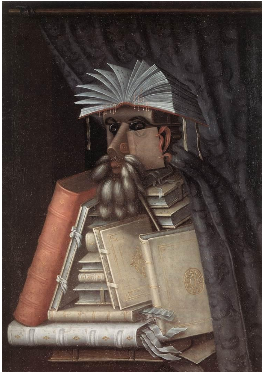
Giuseppe Arcimboldo, Le Libraire, c. 1566