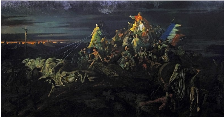
Le Char de la mort , Théophile Schuler, 1848 (Musée Unterlinden)