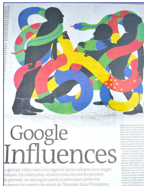
Dessin : Stéphane KIEHL Référence antique : la sculpture du Laocoon