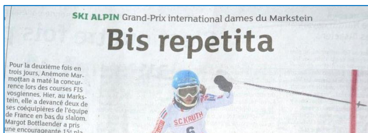
Source : Dernières Nouvelles d'Alsace Référence antique : citation latine