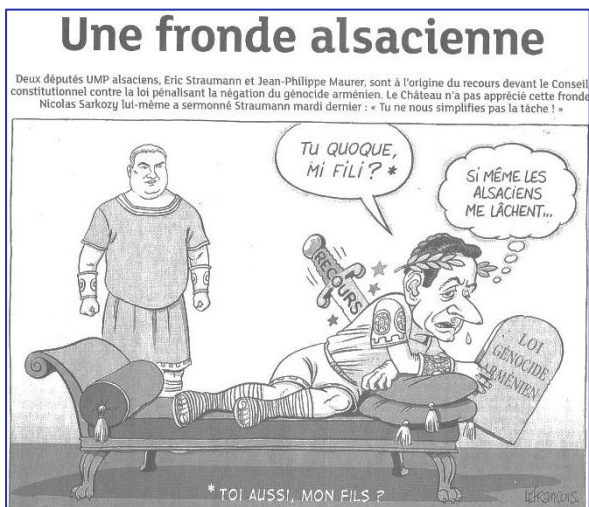
Dessin : Yannick LEFRANÇOIS Référence antique : le meurtrre de Jules César (avec citation en latin)