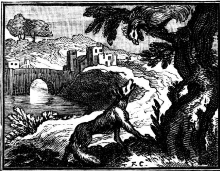
François Chauveau (1613-1676)