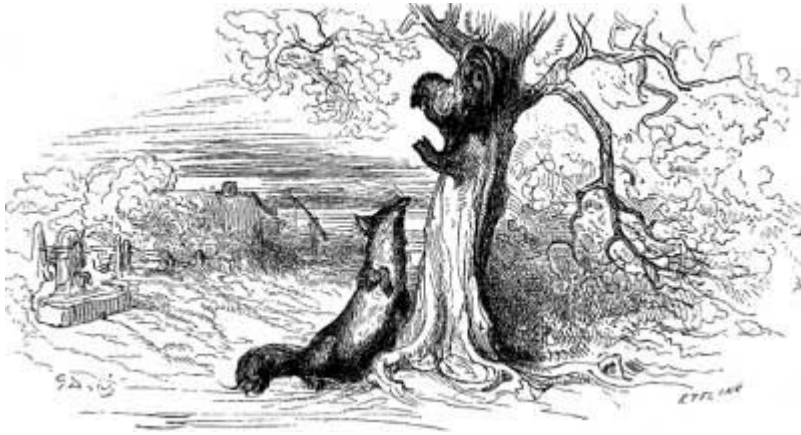
Gustave Doré (1866)