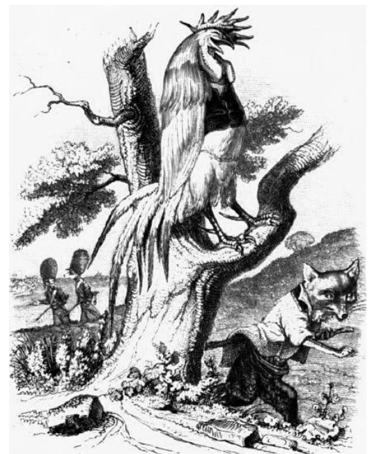
Gravure de Grandville (1803-1847)