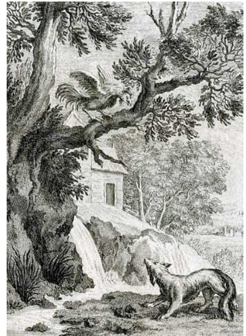
Jean-Baptiste Oudry (1686-1755)