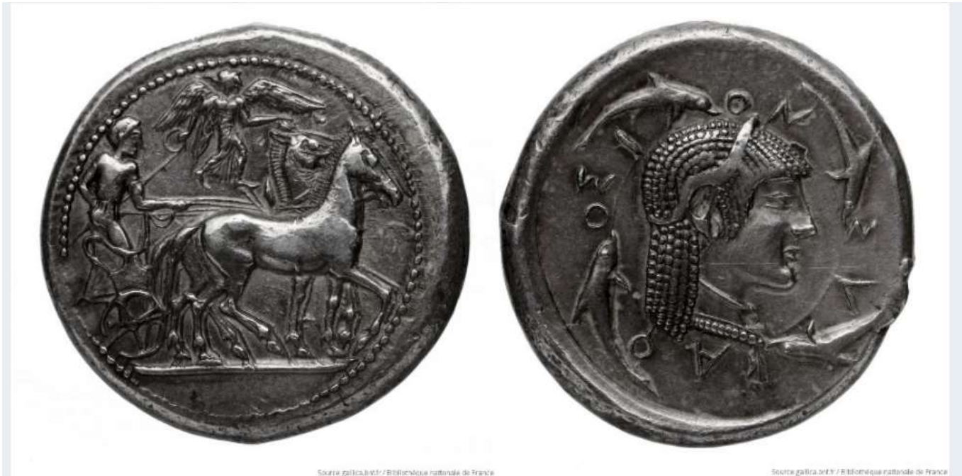
Tétradrachme de Syracuse par Kimon, c. 405–395, argent.