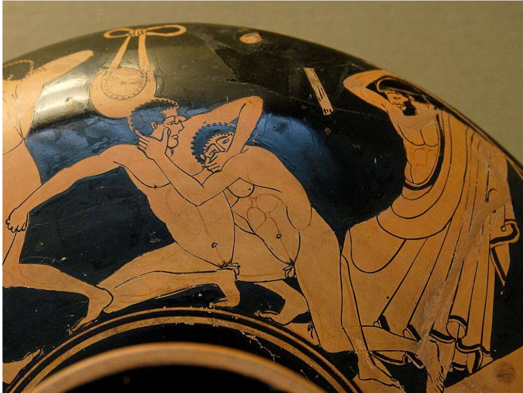
Kylix du Peintre de la Fonderie, v. 490-480 av. J.-C. British Museum (E 78).