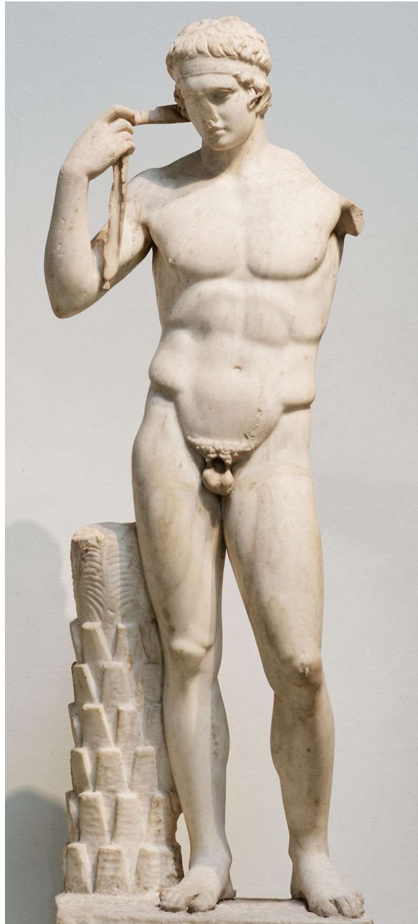
Le Diadumène Farnèse. British Museum.

Le Diadumène Farnèse , conservé au British Museum