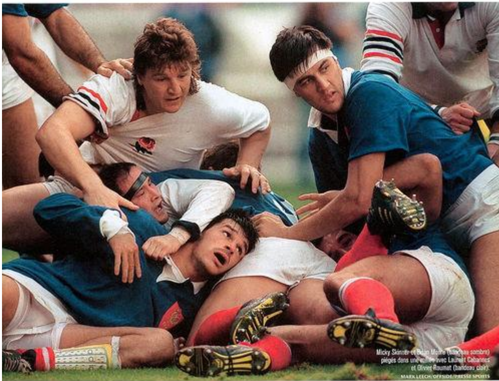
Micky Skinner et Brian Moore (maillots clairs) au milieu d'une mêlée avec Laurent Cabannes et Olivier Roumat (maillots sombres).