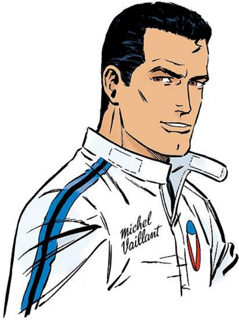
Michel Vaillant de Jean Graton, héros du journal Tintin

Document 6. Objectif : étudier les procédés de l'héroïsation et l'ambiguïté du statut de Ronaldo