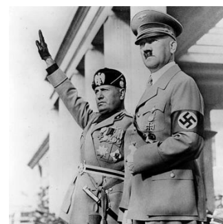
Hitler e Mussolini, detto il Duce