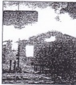
Americans watched aghast as Los Angeles burned

5 "A lot of hopes were lost, and yet out of this violence and ugliness came new hope." Mr Bush told an audience that "new hope" had come out of the 1992 riots - but on the streets, demonstrators* protested that nothing had