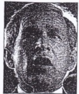
Bush: "New hope"