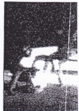
The Rodney King beating caught by chance on video

Fifty-five people were killed in the riots, about 2,000 injured*, and another 12,000 arrested. (...)