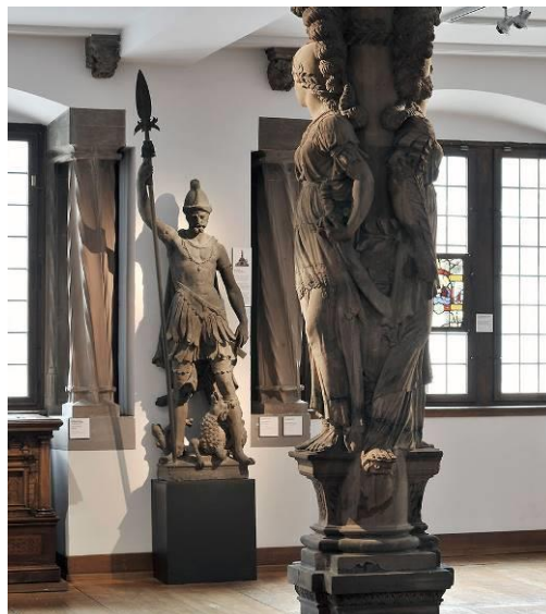
Guerrier Mars, provenant de la façade de la maison de l'Œuvre Notre-Dame, vers 1580

Geplante Führungen auf Deutsch für das breite Publikum: 25.11, 16.12, 13.01 und 17.02 um 15.00 Uhr