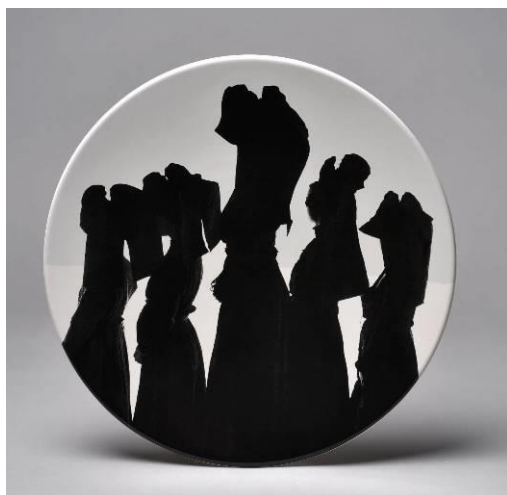
Charles Fréger, Alsaciennes , 2019. Céramique. Strasbourg, Musée Alsacien