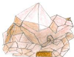
Un bâtiment du futur

Tu habites dans une ville. Imagine-toi à quoi elle pourrait ressembler il y a 100 ans et à quoi elle pourra ressembler dans 100 ans. Que faut-il en tous les cas conserver et pourquoi ? Quelle apparence auront les bâtiments du futur ? Tu habites dans un village.