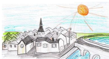
Ma petite ville dans 100 ans