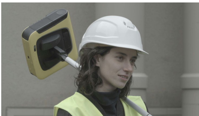
Il faut fabriquer ses cadeaux CH - 11' de Cyril Schäublin

Un bouleversant récit autobiographique qui expérimente une technique d'animation inédite. Jan Koester superpose sur son propre corps, à la façon d'une peinture en mouvement, une série de photographies qui témoignent de son enfance solitaire et de son impuissance face à l'alcoolisme de sa mère. Les pixels télescopés s'y entrecroisent et déconstruisent les normes prédominantes en matière de genre.