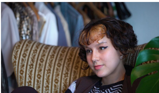
Crushed de Ella Rocca