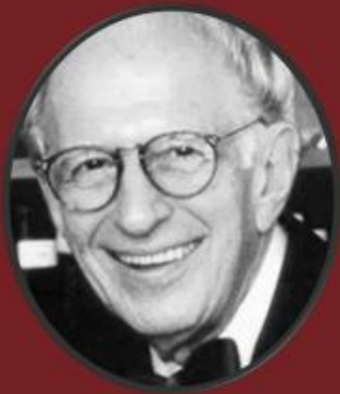
Michael Balint Psychanalyste anglais Années 50