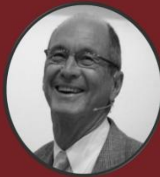
David Kolb Pédagogue nord américain Années 80