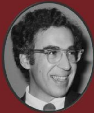
Donald Schön Philosophe américain Années 80