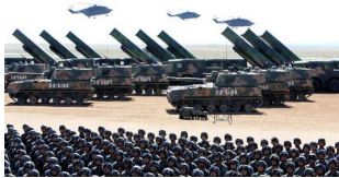
Démonstration de force de l'armée de la République Populaire de Chine, en octobre 2019