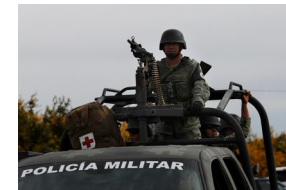
Armée mexicaine mobilisée dans la lutte contre les cartels de drogue.