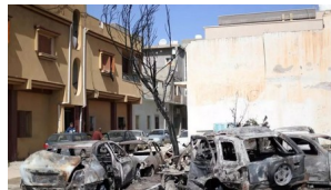
Stigmates des combats dans le quartier d'Abu Salim, à Tripoli, en Libye, le 17 avril 2019