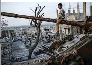
Un garçon à Kobané (Nord de la Syrie) en mars 2015, quelques semaines après que le groupe armé État islamique a été chassé de la ville par les forces kurdes et leurs alliés.