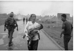
Après le bombardement au napalm du village de Trang Bang, par l'aviation du Sud Vietnam, 8 juin 1972, Nick Ut. flickr.com