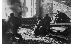
Stalingrad. Décembre 1942. Soldats soviétiques retranchés dans l'usine Octobre rouge