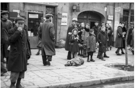
Dans le ghetto de Varsovie, en 1942, von Bundesarchiv, Bild 101I-134-0771A-39 / Zermin / CC-BY-SA 3.0,