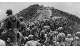
Des soldats américains prennent d'assaut une crête lors de la guerre de Corée, en 1951.