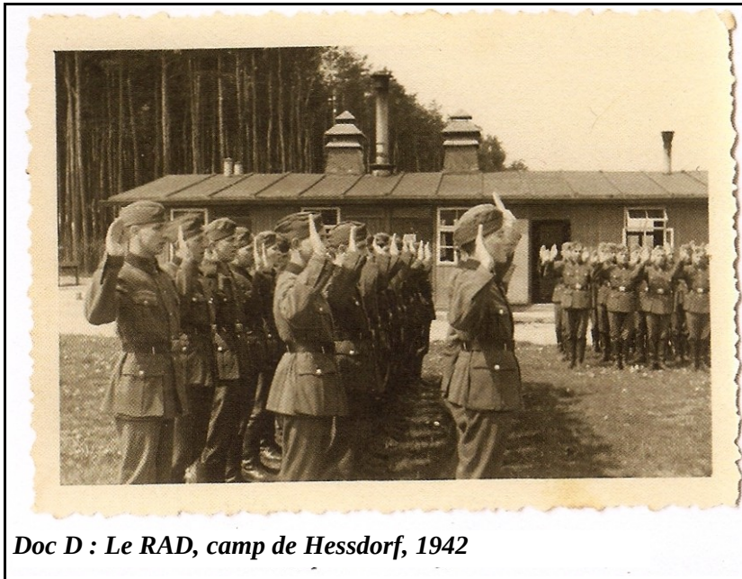
Doc D : Le RAD, camp de Hessdorf, 1942