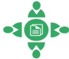
Méthodes et démarches