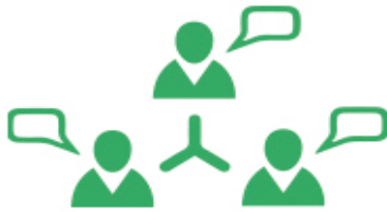
Principes et objectifs

L'enseignement moral et civique (EMC) a été créé par la loi du 8 juillet 2013 d'orientation et de programmation pour la refondation de l'École de la République. Ce nouvel enseignement est mis en œuvre de l'école au lycée à partir de la rentrée 2015. Il se substitue aux programmes d'éducation civique existants à chacun des niveaux de l'école élémentaire, du collège et du lycée.