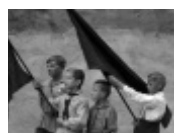
Tina Modotti, Jeunes Pionniers , 1932