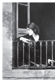
Edward Weston, Tina Modotti , 1923