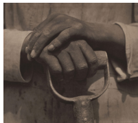
Tina Modotti, Mains sur un outil , 1927, épreuve contemporaine sur platine..