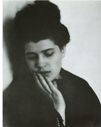
Tina Modotti, Autoportrait , 1922

Émigrante italienne, communiste, modèle, photographe, clandestine, brûlante méditerranéenne, compagne d'Edward Weston, agent soviétique, femme fatale, muse d'hommes, révolutionnaire ? La vie de Tina a fait l'objet de nombreuses expositions monographiques, de catalogues et de reconstructions romancées. Sa vie sensationnelle a un peu occulté sa photographie. Deux points sont à souligner : une vie faite d'exils, de voyages et d'errances et la brièveté de la carrière de photographe scindée en deux périodes, l'une dite formaliste et l'autre dite engagée.