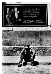
Tina Modotti, Elégance et pauvreté , 1927, épreuve gélatino-argentique, 25 x 16 cm, Mexico, INBA