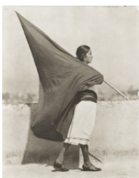
Tina Modotti, Femme avec drapeau , 1928, épreuve au palladium, 24,9 x 19,7 cm, New York, MoMA