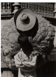
Tina Modotti, Homme portant du foin , 1926, épreuve gélatino-argentique, 9,4 x 7,3 cm, Collection Ruth et Labrie Ritchie