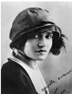
Anonyme, Tina Modotti à Hollywood , 1920-1921

En mars, le journal El Machete est fondé. Weston part en Californie à la fin de l'année.