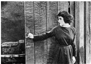
Tina Modotti dans le film Tiger's Coat