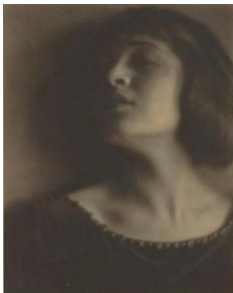
E. Weston, Tina Modotti , 1921