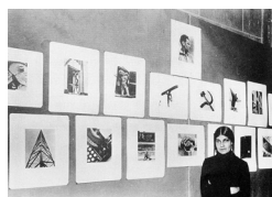
Anonyme, Tina Modotti dans son exposition à la bibliothèque nationale de Mexico , décembre 1929