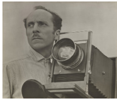
Tina Modotti, Photographie d'Edward Weston à la caméra , 1924, 17 x 22,5 cm, New York, MoMa