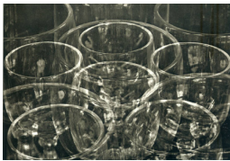
Tina Modotti, Verres , 1925, tirage au platine, 20,3 x 25 cm, New York, collection Throckmorton Fine Art