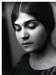
Tina Modotti, 1921