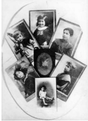
Photographies de famille de Tina Modotti