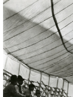
Tina Modotti, Tente de cirque , 1924