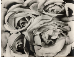
Tina Modotti, Roses , 1924, tirage au palladium (platine), 18,8 x 21,6cm, New York, Moma