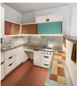
11. C. PERRIAND, Cuisine bar, 1952, Paris, MAD.