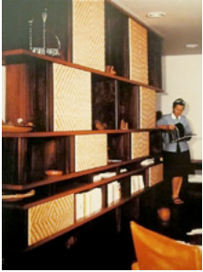
13. Photographie de la bibliothèque du salon de Jacques Martin, Rio de Janeiro, vers 1963.