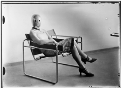
8. Inconnue dans un fauteuil tubulaire de M. BREUER portant un masque de O. SCHLEMMER, 1926.