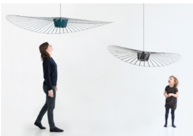
17. C. GUISSSET, Deux modèles de la lampe Vertigo.