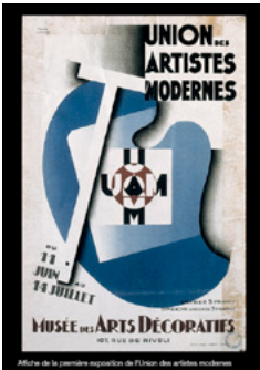
9. P. COLIN, Affiche de la première exposition de l'UAM, 1930, lithographie, Paris, MAD.