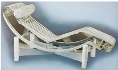
10. C. PERRIAND, Chaise longue basculante, 1940, bambou, Paris, MAD.