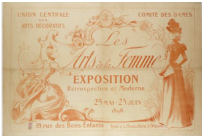
1. Affiche de l'exposition Les Arts de la Femme , 1898, lithographie de L. MORIN, Paris, Musée Carnavalet.