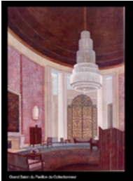
7. J. É. RUHLMANN, Grand Salon du Pavillon du Collectionneur, fac similé d'une gouache originale, 1925, Paris, MAD.