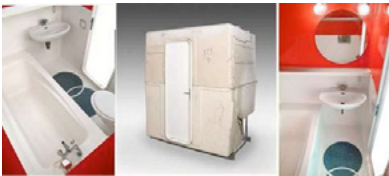
14. C. PERRIAND, bloc Salle de bains pour la station des Arcs, 1975.