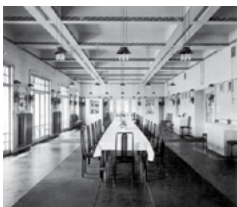
4. Salle à manger du sanatorium de Purkersdorf, J. HOFFMANN, architecte, 1904-1905, Vienne.