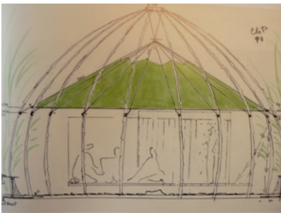
16. C. PERRIAND, Dessin pour la Maison de thé, 1993.