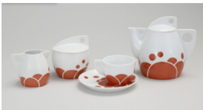
3. J. SIKA, Service à thé, New York, 1902, porcelaine, Cooper Herwitt.