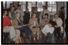
15. Photographie de J. Prouvé et C. Perriand en 1983 à l'inauguration de l'ENSCI.