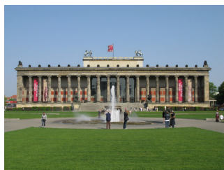
Altes Museum, 1830, Schinkel

Les monuments construits par les rois de Prusse sont l' Altes Museum en 1830 (qui reproduit la rotonde du Panthéon de Rome), le Neue Wache en 1818 (le corps de garde) sur l'avenue Unter den Linden , le Schauspielhaus sur le Marché des Gendarmes . Karl Friedrich Schinkel , architecte des rois de Prusse, imagine un programme dans un style néo-classique pour la capitale. L'ambition est de créer une Athènes sur les bords de la Spree.