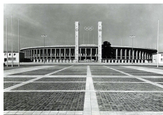
Olympiastadion, 1936, Werner March