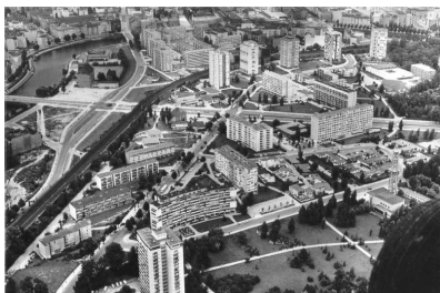
Interbau, Hansaviertel, 1957