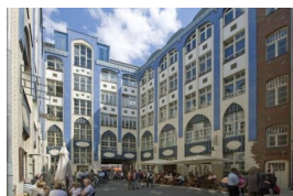
Häckesches Hofe, rénovation