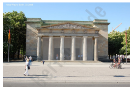
Neue Wache, 1818, Schinkel