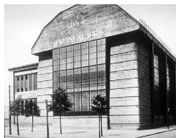
AEG Turbinenhalle, 1909 Peter Behrens