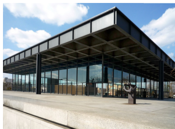
Neue Nationalgalerie, 1968, Ludwig Mies van der Rohe