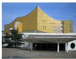
La Philharmonie 1963, Hans Scharoun