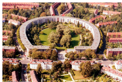
Le Fer à cheval, 1927 Bruno Taut et Martin Wagner