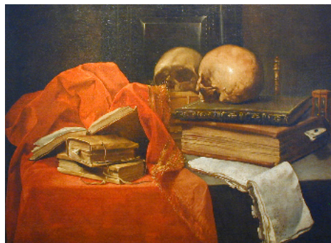
Madeleine de Boullongne, Vanité, XVI e siècle Collection Société Industrielle de Mulhouse, don Adolphe Mieg 1884

Les Vanités: genre pictural, sont le plus souvent une nature morte composée d'objets fortement symboliques, tels que le crâne, la bougie, le sablier ou la fleur qui se fane, évoquant la fuite du temps.