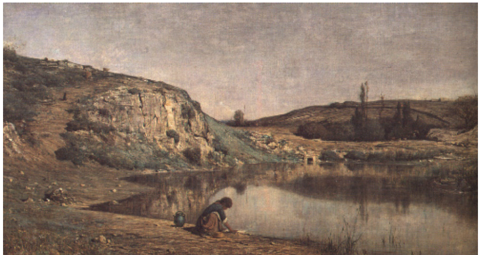
Adolphe Appian, Bords du lac du bourget , 1866 envoi de l'État 1866

Les paysages impressionnistes constituent l'apogée du genre. Ils en marquent aussi l'apogée : sous l'influence des précurseurs que