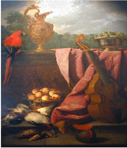
Desportes, Nature morte, huile sur toile, 1733 Collection Société Industrielle de Mulhouse, don Société des Arts 1843

illustrés par les œuvres du Musée des Beaux-Arts de Mulhouse