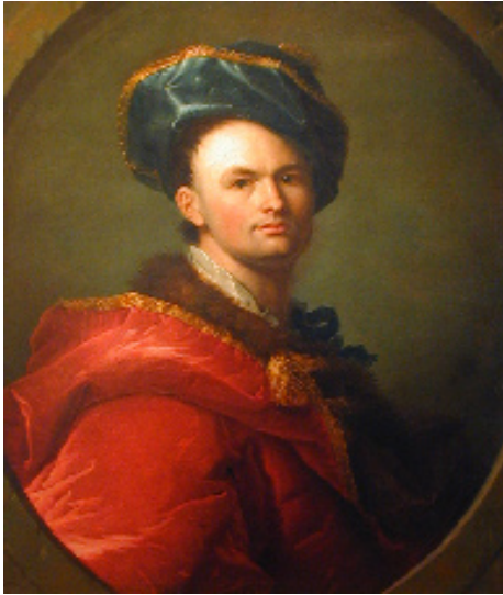
Jean-Gaspard Heilmann, Autoportrait , XVIII e siècle Collection Société Industrielle de Mulhouse, don Engel-Dollfus 1869

A partir de la Renaissance et jusqu'au XIX e siècle, les sujets des tableaux étaient classés par genres. Les genres sont liés aux connaissances esthétiques, scientifiques, littéraires, plastiques et culturelles d'une époque.