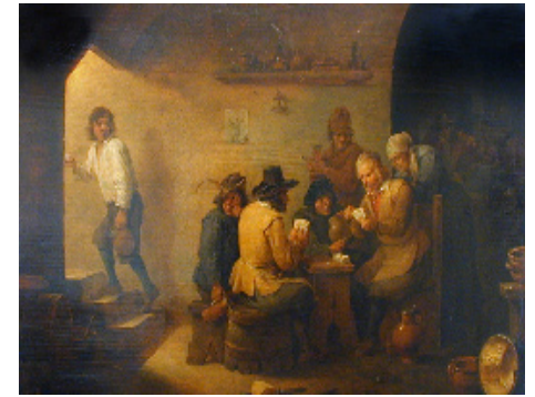
David Teniers le jeune, Intérieur de cabaret, 1660 Legs Alfred Wallach 1961

Au XIX e siècle, nombre de grands peintres pratiquent peu la peinture de genre. On la retrouve sous des nouvelles formes, chez les peintres du début du XX e siècle, qu'il s'agisse de Picasso ou de Matisse.