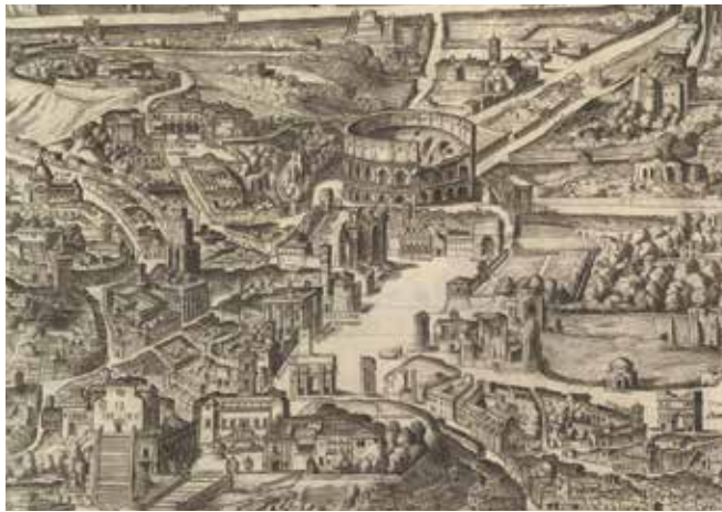
Antonio Tempesta (Florence, 1555 – Rome, 1630), Plan de Rome (détails), 1593 (1 re édition). Gravure