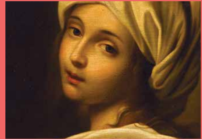
Anonyme, Femme au turban (détail), portrait présumé de Beatrice Cenci, 2 e moitié du xvi e siècle (1650-1700), Huile sur toile, 0,604 × 0,77 m. MNR912, Paris, musée du Louvre

À l'occasion des représentations par l'Opéra national du Rhin de l'opéra Beatrice Cenci d'Alberto Ginastera créé en 1971, le Musée des Beaux-Arts se penche dans une exposition-dossier sur cette héroïne qui enflamma l'imaginaire européen depuis sa mort.