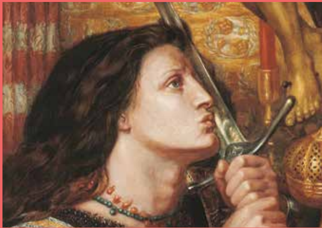
Dante Gabriel Rossetti, Jeanne d'Arc embrassant l'épée de la Délivrance (détail), 1863 Strasbourg, Musée des Beaux-Arts (dépôt du Musée d'Art moderne et contemporain de Strasbourg)