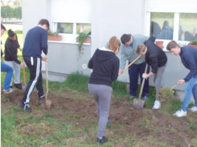
Création d'un potager bio