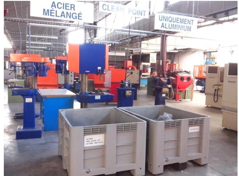
Tri des copeaux sur les plateaux techniques