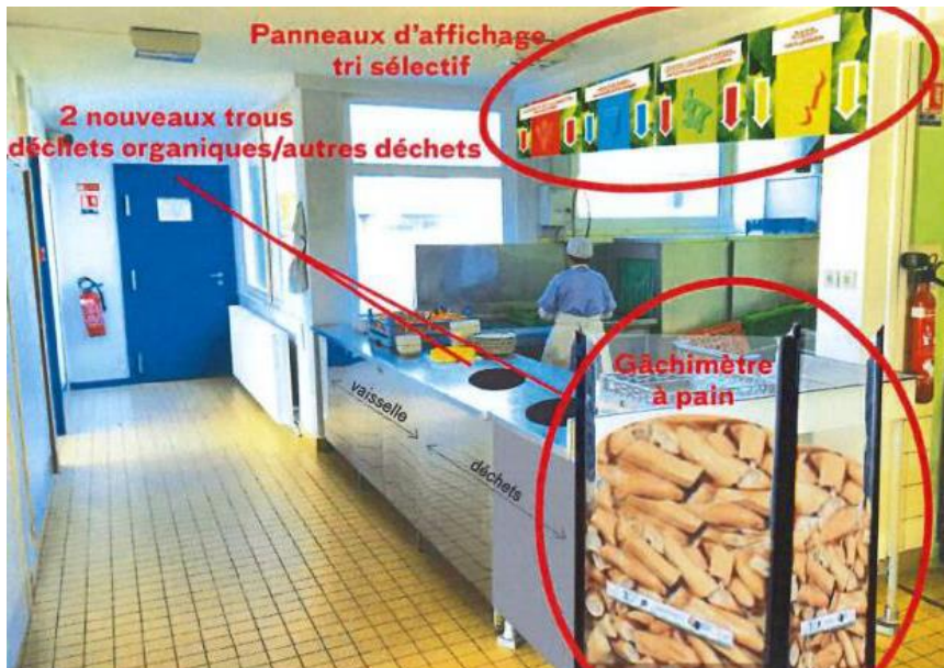
Valorisation du tri des déchets à la demi-pension