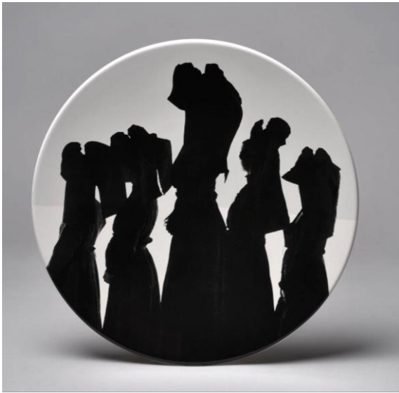
Charles Fréger, Alsaciennes , 2019. Céramique. Strasbourg, Musée Alsacien