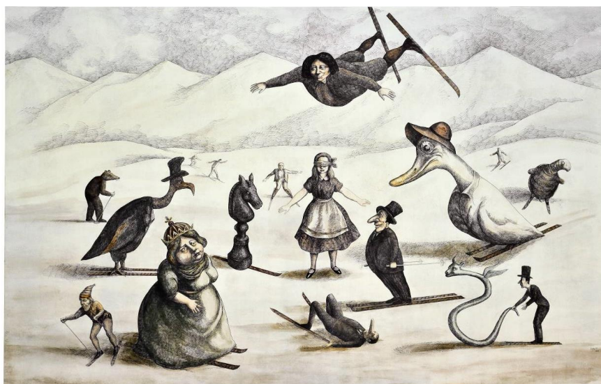
Roland Topor, Alice à la neige , 1971. Estampe pour Alice's Adventures in Wonderland , Penny Royal, University of California Press / Berkeley, Londres, 1982. Strasbourg, Musée Tomi Ungerer © Barry Moser and Pennyroyal Press, 1982

Geplante Führungen auf Deutsch für das breite Publikum (nur Museum Tomi Ungerer): 14.01 und 11.02 um 15.00 Uhr