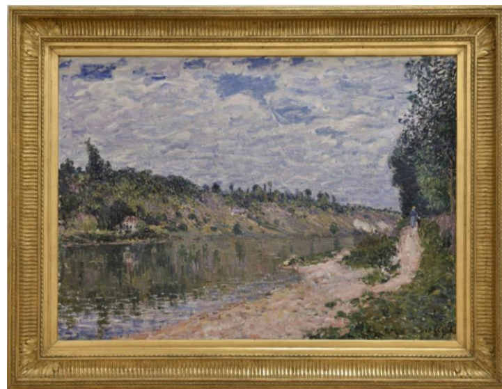
Alfred Sisley, Les coteaux de La Celle vus de Saint-Mammès, après-midi de septembre , Strasbourg, MAMCS. Œuvre récupérée à la fin de la Seconde Guerre Mondiale, déposée par l'office des biens et intérêts privés (OBIP) ; en attente de sa restitution à ses légitimes propriétaires.