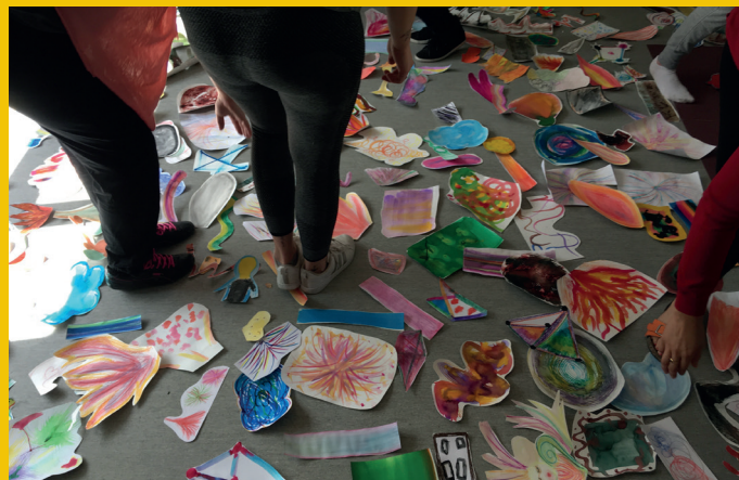
A quoi rêvent les méduses ?

Cette saison sera la première saison d'Art'Rhena au sein de sa salle. Une grande première donc ! Au total, 30 spectacles seront proposés mais également toute une programmation en temps scolaire , elle aussi, bilingue autant que possible, accessible et diverse. Un programme d' éducation artistique et culturelle assurera une coopération forte avec les établissements scolaires, les associations et les structures sociales du territoire. Ce lien vise à promouvoir les échanges franco-allemands et le rapprochement entre les publics grâce aux outils des arts et de la culture.