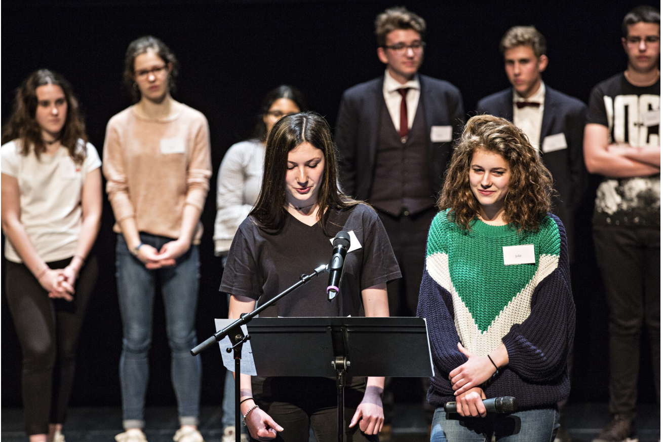
Cérémonie de remise du prix, 2 e Édition

En collaboration avec des professionnel-le-s du théâtre, les élèves découvrent des textes théâtraux contemporains au moyen d'ateliers pratiques et participent à la remise d'un prix littéraire ambitieux. Ce projet doit ainsi permettre aux jeunes de nouer un lien fort avec les écritures contemporaines grâce à la rencontre avec des auteur-e-s d'aujourd'hui et à la fréquentation du lieu, des artistes de la saison et de leur création.