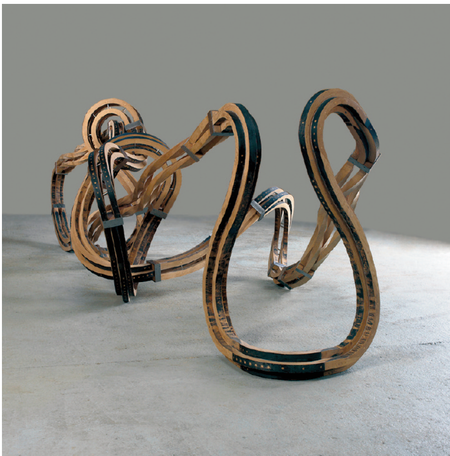
Richard Deacon, Quick, 2009