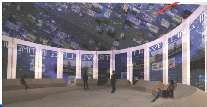
Le forum : 4 min d'images vidéo mappées évoquant des discours historiques, des paysages mélangés de grands monuments européens, des personnages illustres associés à la diversité des individus et des langues pour immerger les visiteurs dans les grandes valeurs culturelles, économiques et politiques des Européens.