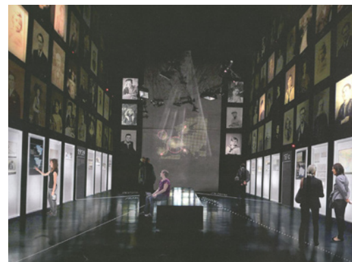
La Galerie des portraits modifiée

Au plaisir de vous retrouver au Mémorial.