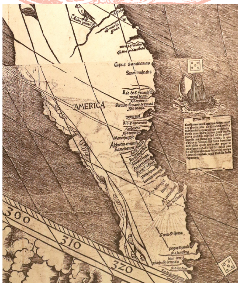
DÉTAIL DU PLANISPHÈRE DESSINÉ PAR LE CARTOGraphe WALDSEEMULLER AU XVI e DIÈCLE (FAC-SIMILÉ)