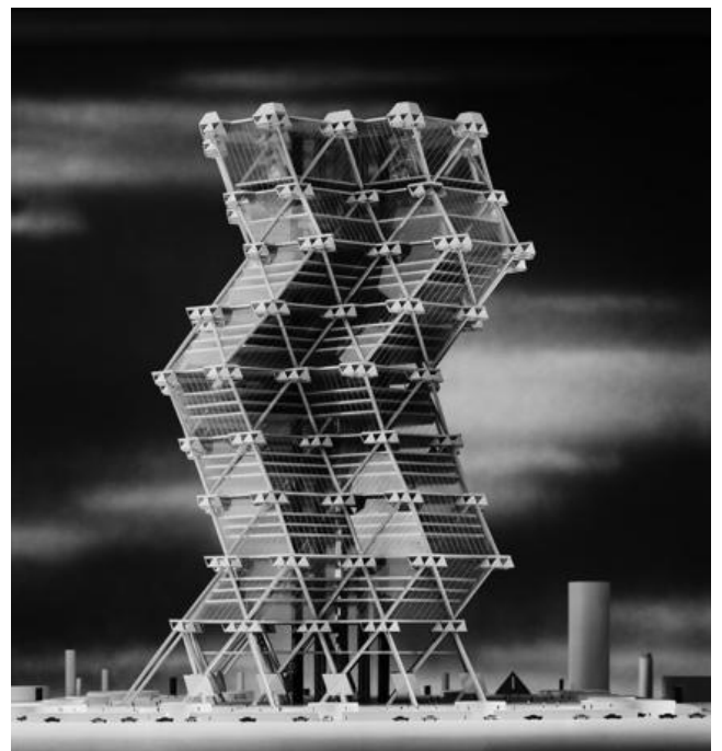
Tour à Philadelphie -Architecte Louis Kahn