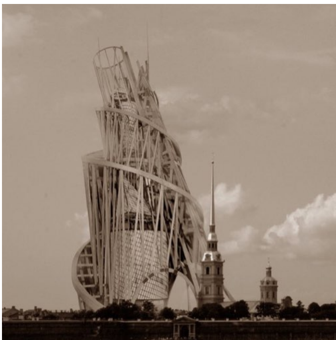
Monument à la troisième Internationale -Architecte Tatlin