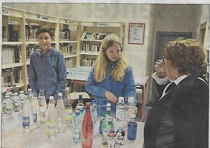
Les collégiens dannemariens avaient aussi proposé un bar à