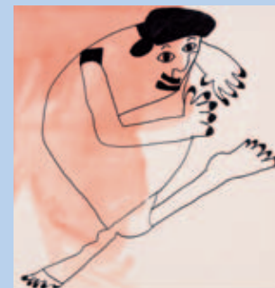
Holger Frischkorn Goldstein Variationen , 2007 Collection / Sammlung Würth, inv. 11505 © Atelier Goldstein – Photo : Scanner GmbH, Künzelsau

Mit der Ausstellung Art brut. Ein besonderer Dialog mit der Sammlung Würth präsentiert das Musée Würth eine im wahrsten Sinn außergewöhnliche Kunst. Diese „Kunst der Außenseiter“ entstand zunächst in psychiatrischen Einrichtungen und wurde später auch bei Autodidakten entdeckt, die oft am Rande der Gesellschaft lebten.