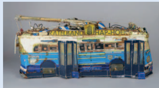
Willem van Genk Autobus, 1990 Collection / Sammlung Antoine de Galbert, Paris

informed doctors, they have then, in the 1920s, interested and attracted the surrealists, then were recovered, at the dawn of the Second World War, by the Nazi ideology to feed the propaganda around the «degenerate art». It is only in 1945 that the artist Jean Dubuffet theorizes the concept of «Art brut», to question the very definition of art after a devastating world conflict. Since then, other designations have been imagined and discussed: singular art, Outsider Art or popular art.