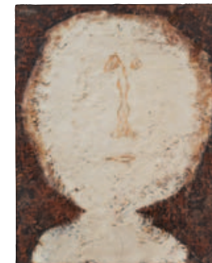
Jean Dubuffet La dame blanche, 1952 Collection / Sammlung Würth, inv. 10667

Das Musée Würth veranschaulicht diesen Einfluss, indem es mehr als 20 Werke aus der Sammlung Würth – von Max Ernst über Arnulf Rainer, Asger Jorn bis Georg Baselitz – mit über 130 Werken der Art brut zusammenbringt, die