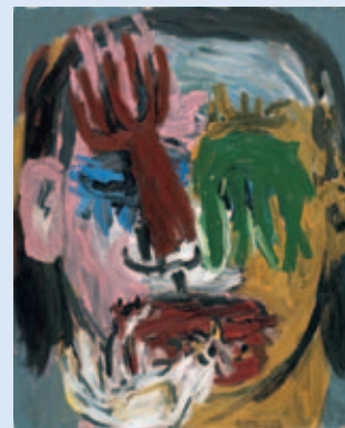
Georg Baselitz /ra, 1986 Collection / Sammlung Würth, inv. 11389 © Georg Baselitz 2022

Le Musée Würth illustre cette influence dans l'exposition en croisant une vingtaine d'œuvres de la Collection Würth – de Max Ernst à Arnulf Rainer, en passant par Asger Jorn ou Georg Baselitz, avec