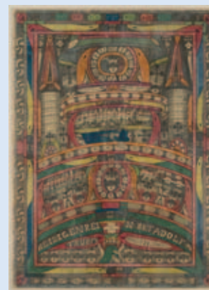
Adolf Wölfli Der Heiligen = Rein, =Skt. Adolf=Thurm, 1919 Collection / Sammlung Antoine Frérot

The Musée Würth illustrates this influence in the exhibition by intersecting over 20 works from the Würth Collection – from Max Ernst to Arnulf Rainer, from Asger Jorn to Georg Baselitz – with more than 130 works of Art brut, from private collections or from the Würth collection, and offers not only the unique opportunity to discover a hidden and intimate world that undeniably resonates within each of us, but also to celebrate the inclusion of otherness in all its forms.