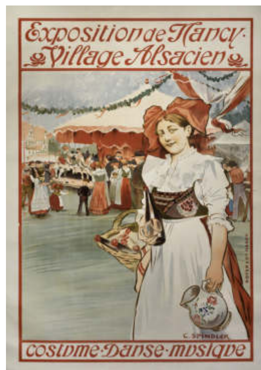
Charles Spindler, Affiche du village alsacien, 1909 Musée Alsacien de la Ville de Strasbourg