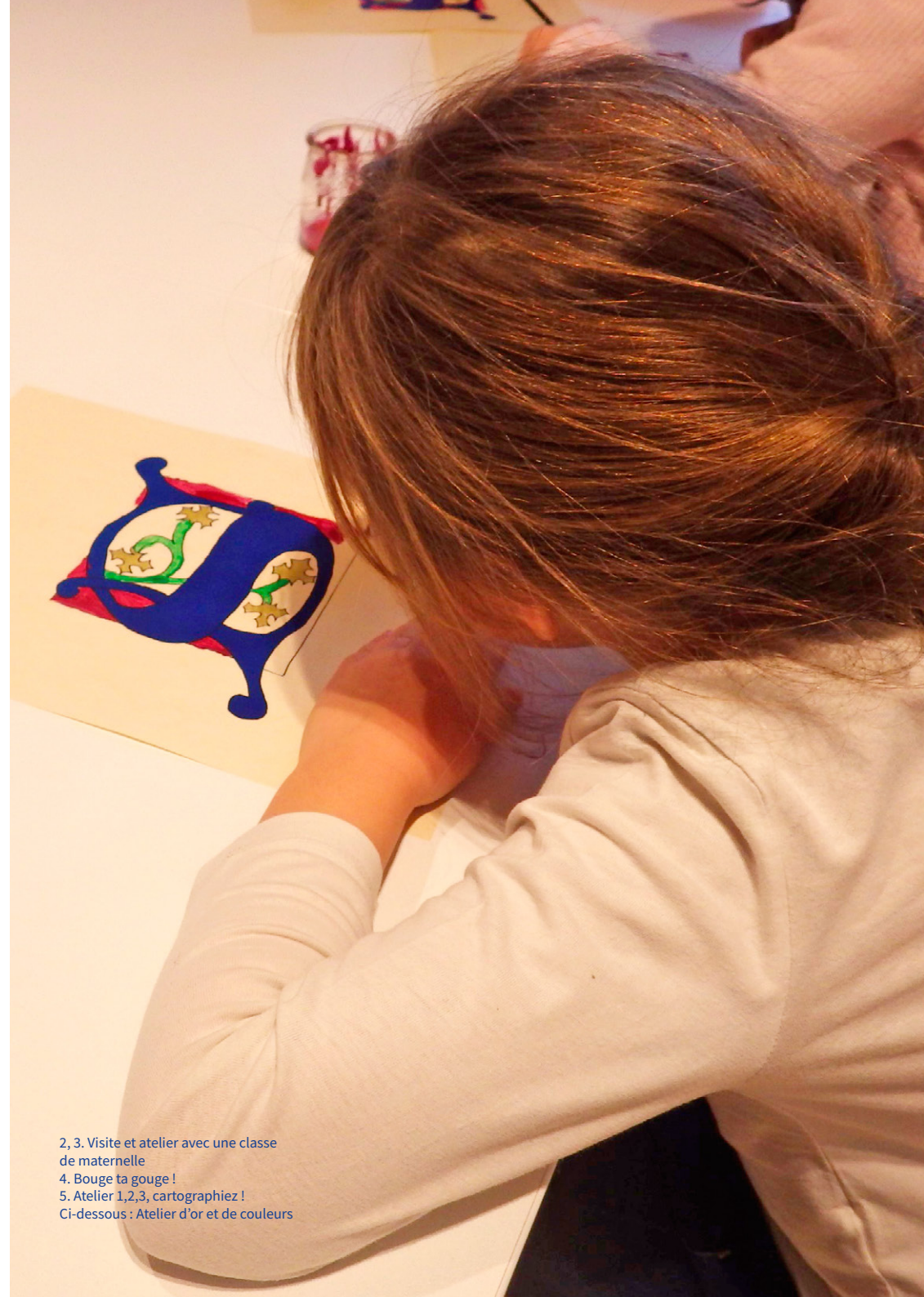
2, 3. Visite et atelier avec une classe de maternelle 4. Bouge ta gouge ! 5. Atelier 1,2,3, cartographiez ! Ci-dessous : Atelier d'or et de couleurs