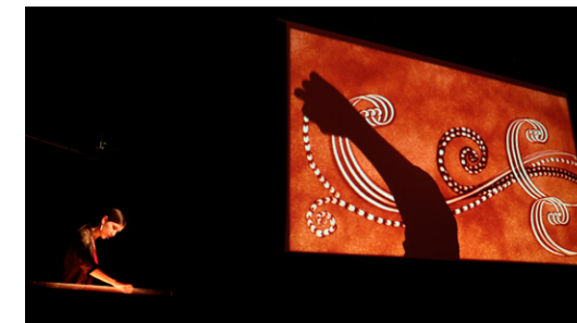
Spectacle Des rêves dans le sable, 2018