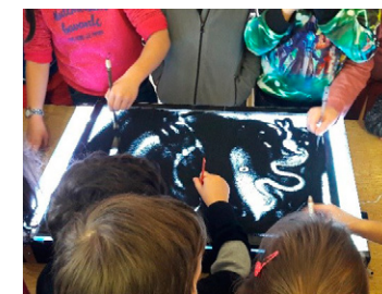
Atelier Des rêves dans le sable

Module de plusieurs heures réparties dans l'année Du CE1 au lycée