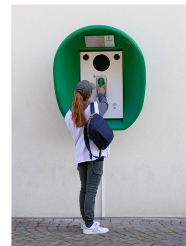
Sélest'art 2021 Numéro Vert Jérémie Rigau deau L'installation permettait d'écouter en direct les sons de la forêt environnante