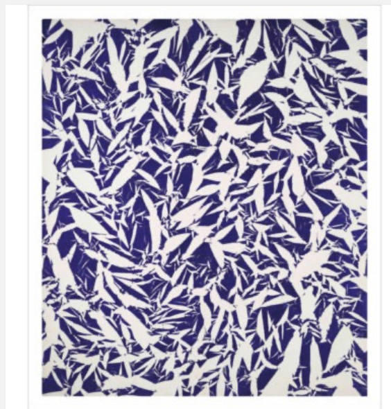
Etudes , Simon Hantai, 1969 Empreintes de papiers froissés