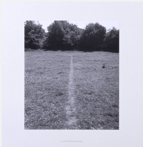
A line made by a walking , Richard Long, 1969 Photographie d'une ligne droite tracée suite à un aller-retour incessant de l'artiste