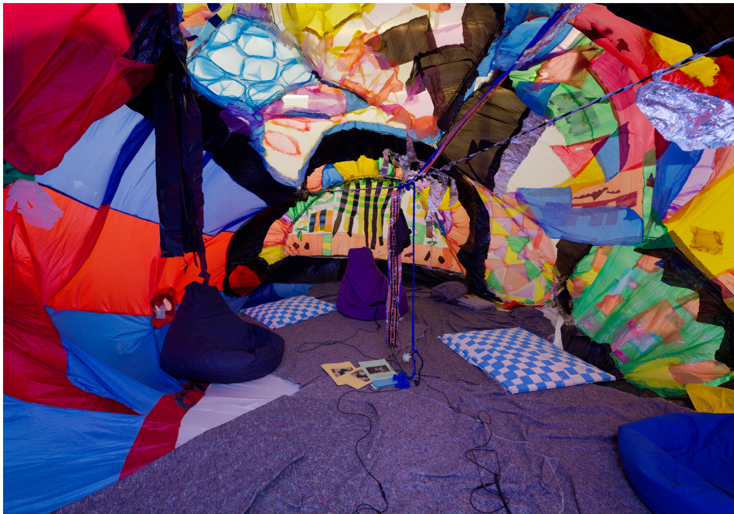
MYCKET collective, Dream Castle [Château de rêve], 2016-18. Plastique réemployé, anciennes voiles de bateau, parapluies et pare-vent cassés, ventilateurs. Dimensions variables.

Dream Castle est une sculpture flottante molle et pleine de recoins, réalisée à partir de plastiques réemployés aux couleurs bigarrées. On peut s'y réfugier au gré de sa forme, modelée par le souffle des ventilateurs. Imaginé puis construit par le collectif MYCKET et quelques participant-es, ce château de fortune questionne notre manière d'habiter l'architecture et suggère «de rêver à l'environnement idéal que nous souhaiterions»*.