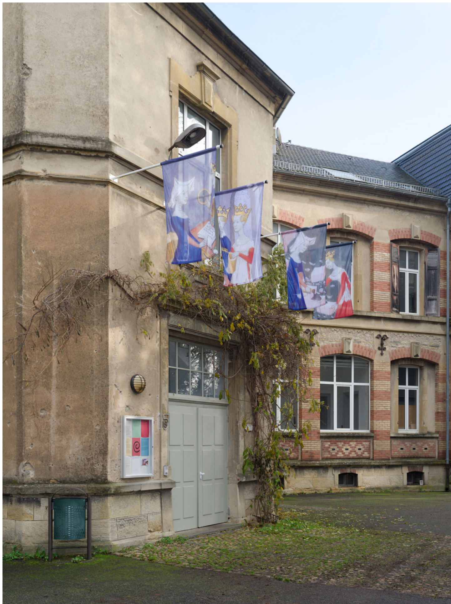
Entrée du @R@ @l@ace.