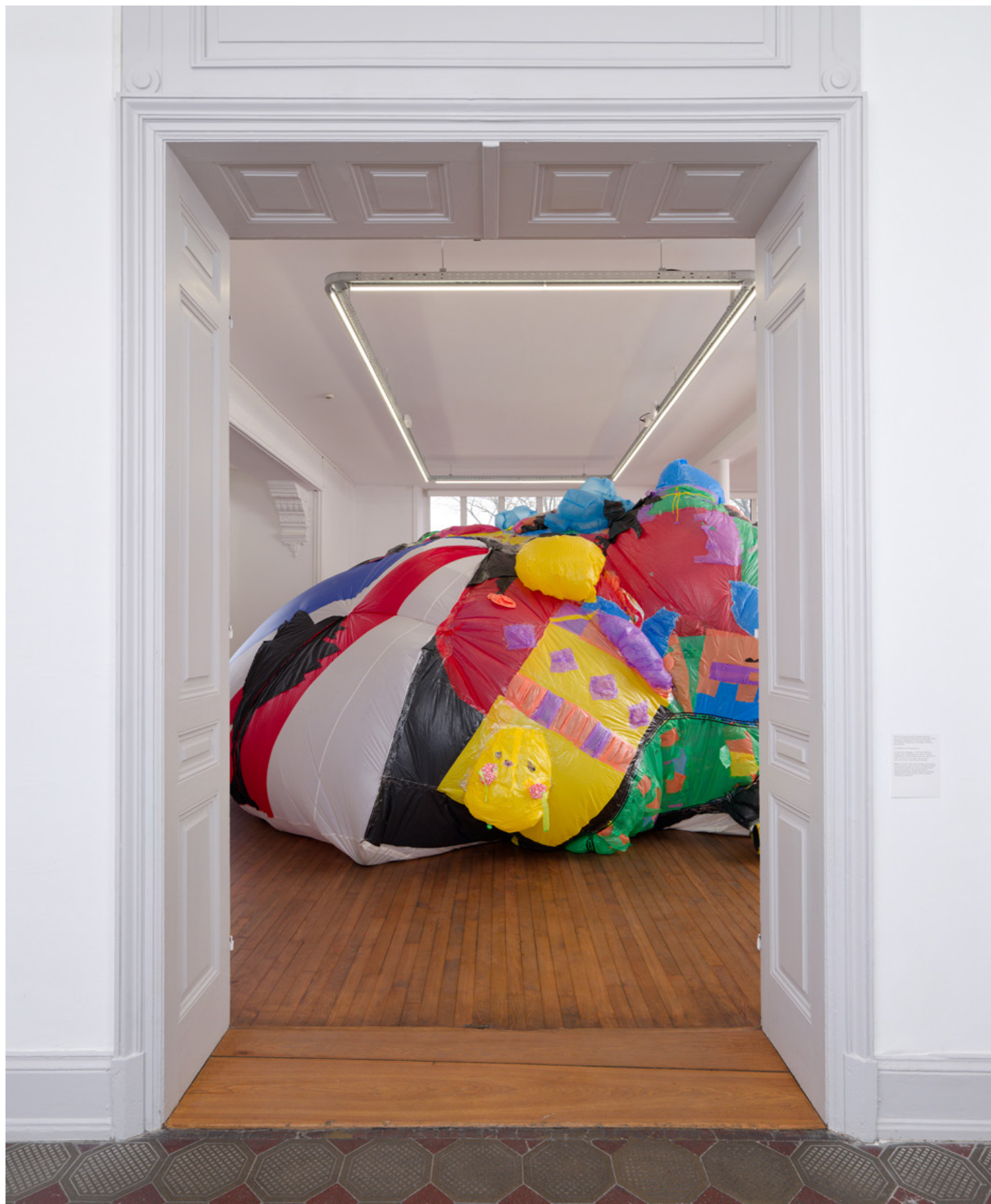
MYCKET collective, Dream Castle [Château de rêve], 2016-18. Plastique réemployé, anciennes voiles de bateau, parapluies et parent cassés, ventilateurs. Dimensions variables. Courtesy des artistes. Photographie Aurélien Mole.