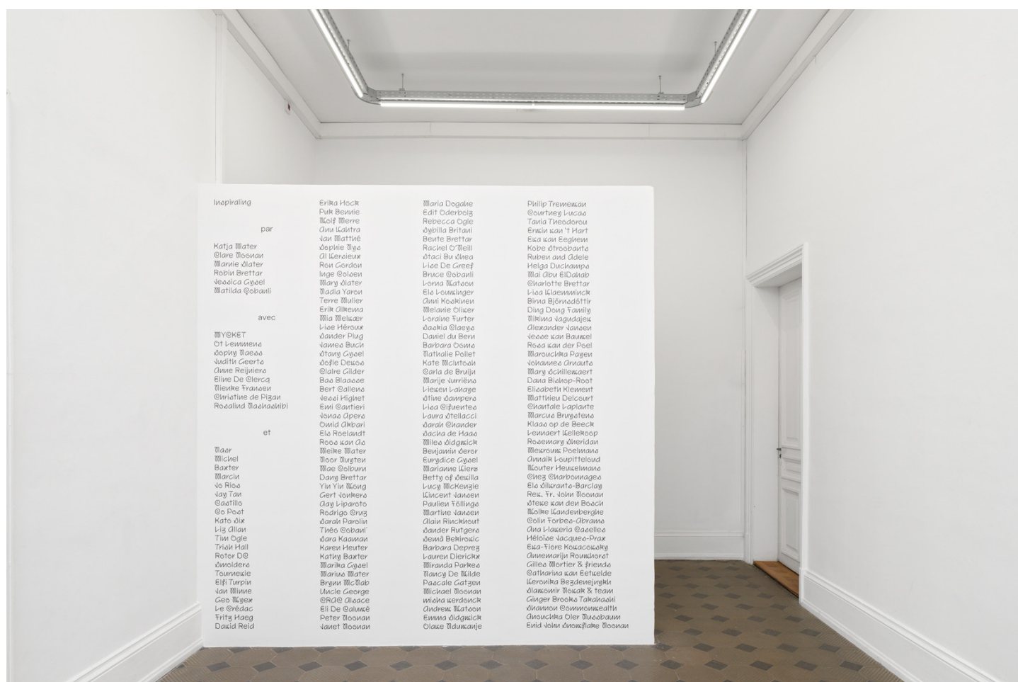
Entrée du @RAD @l@ace.