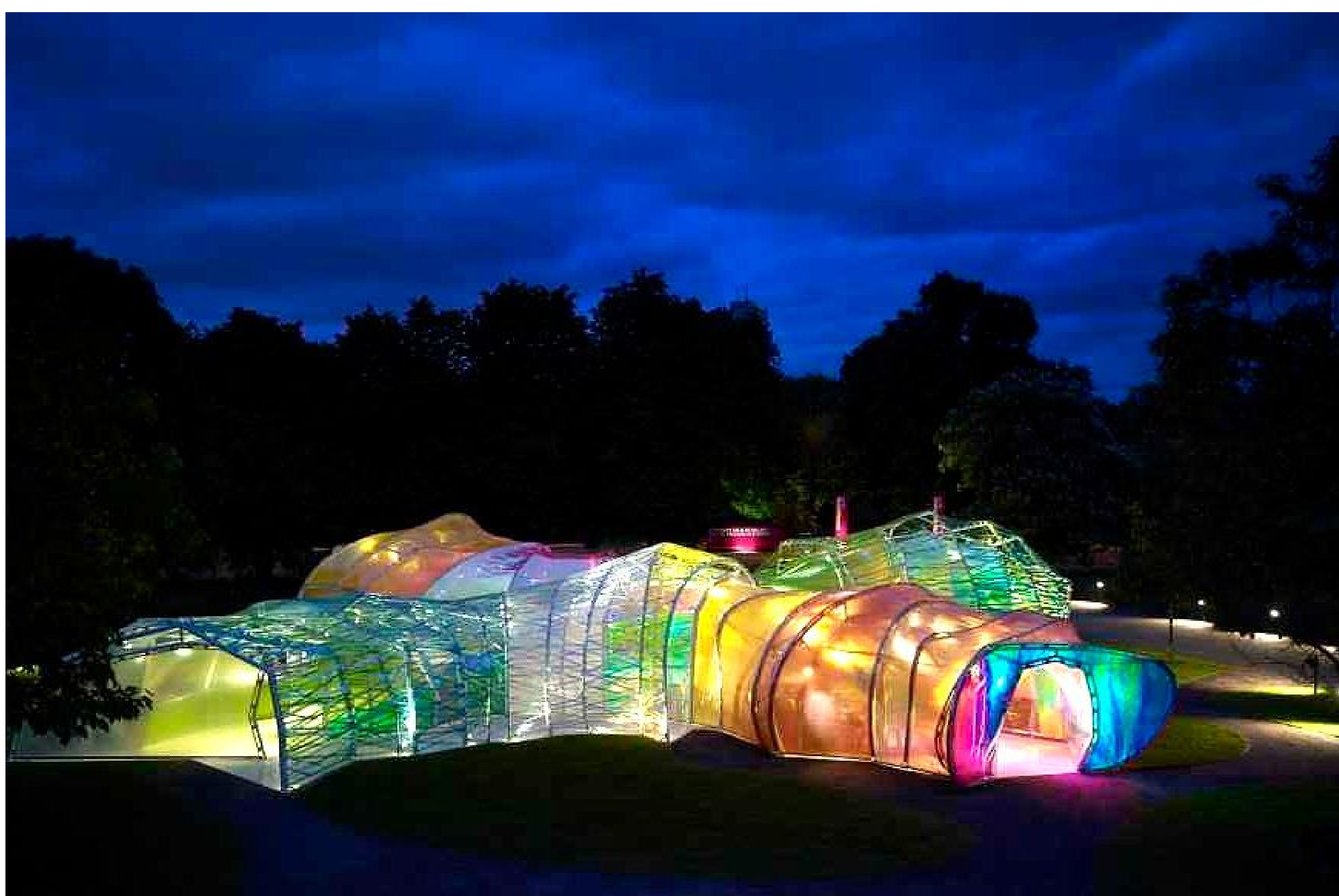
Selgas Cano Pavillon Serpentine Gallery à Londres - 2015