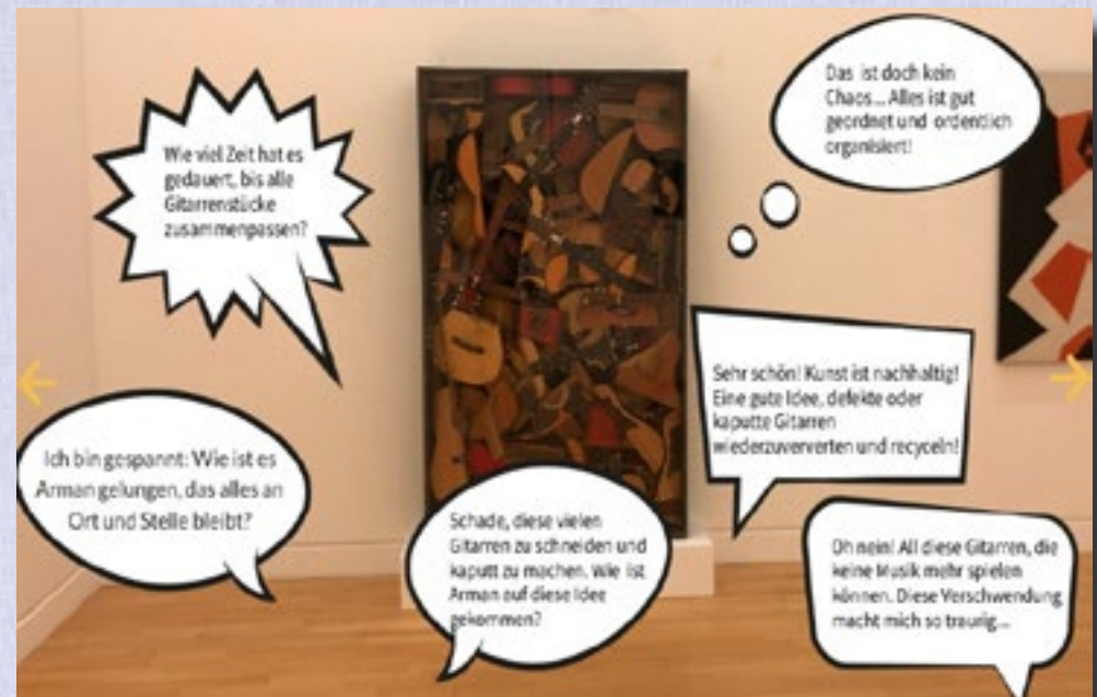
"Livret interactif élaboré par Bernadette Gall"