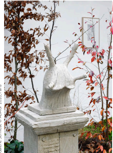
Laurent Le Deunff, tête d'escargot, 2020, Ciment type rocaille, 143 x 50 x 56 cm, Galerie Semiose © ADAGP 2026, Paris

L'exposition est réalisée en partenariat avec la galerie Semiose .