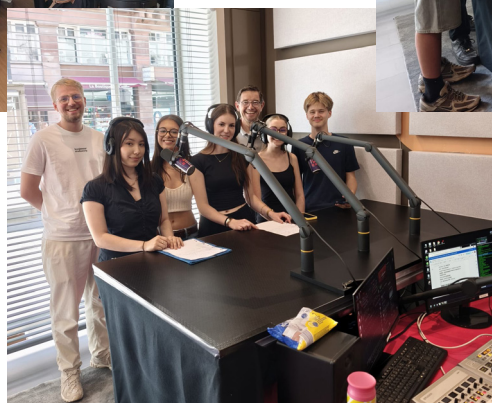
Les élèves du lycée Freppel d'Obernai passent en direct sur RBS