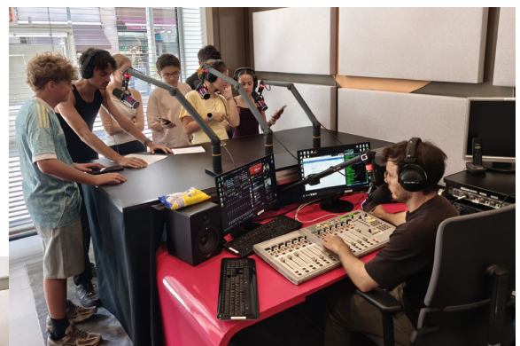
Les élèves du collège Henri Meck de Molsheim passent en direct sur RBS