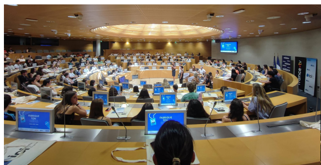
Accueil des élèves dans l'hémicycle de l'Hôtel de Région

Les inscriptions pour l'édition 2026/2027 sont déjà ouvertes sur la plateforme Adage