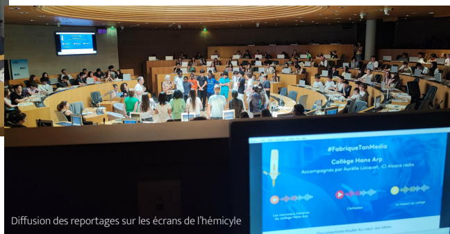
Diffusion des reportages sur les écrans de l'hémicycle